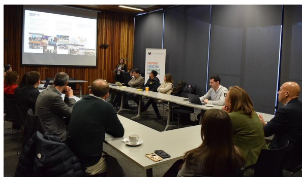
Formato mesa U