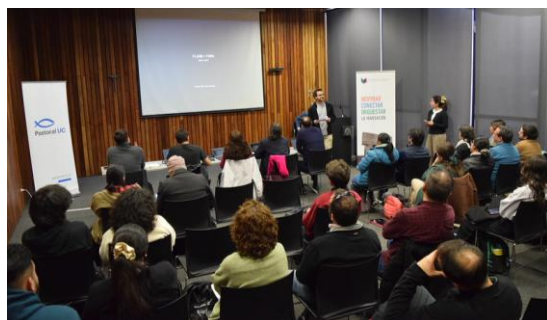
Formato auditorio + mesa de jurado

Los montajes especiales o el trabajo con productoras que requieran la reserva de espacios adicionales, antes o después del día del evento, consideran costos extras. Puedes revisar aquí el “Protocolo de servicios de productoras”.