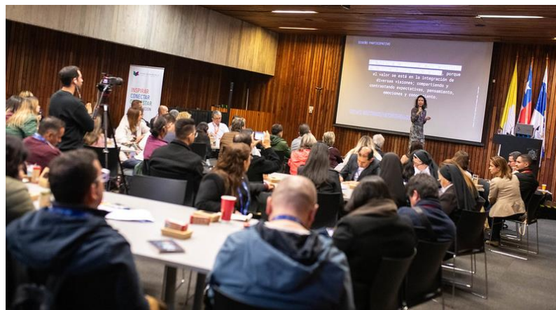
Formato mesas de trabajo (10 mesas, hasta 7 personas por mesa, mirando al escenario)