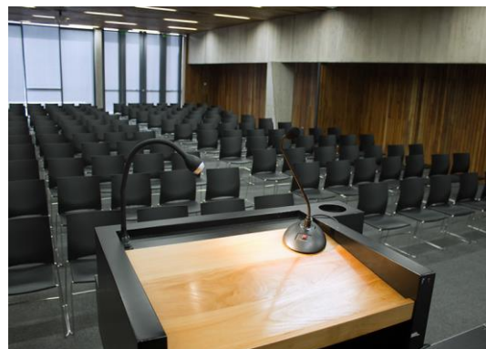
Formato auditorio (sólo sillas)